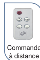
Commande à distance