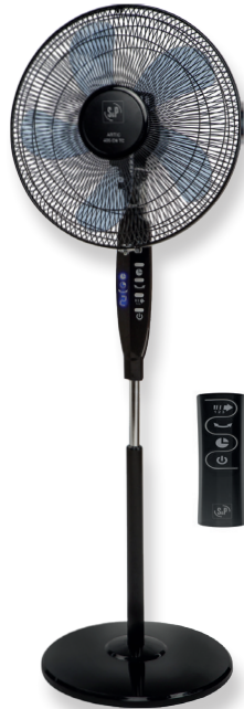
ARTIC 405 CN TC