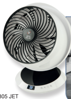
ARTIC 305 JET