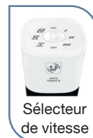
Sélecteur de vitesse