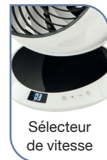
Sélecteur de vitesse