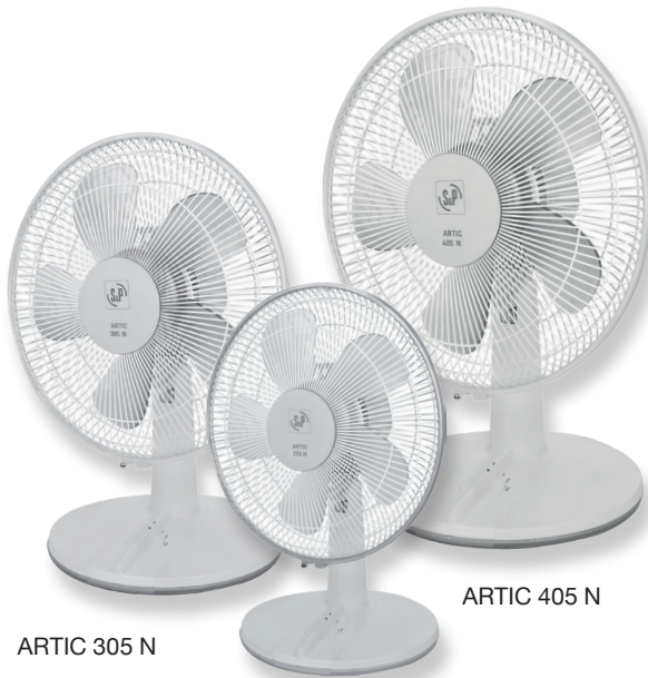
ARTIC 305 N