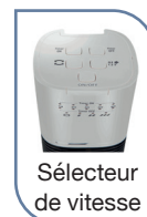
Sélecteur de vitesse