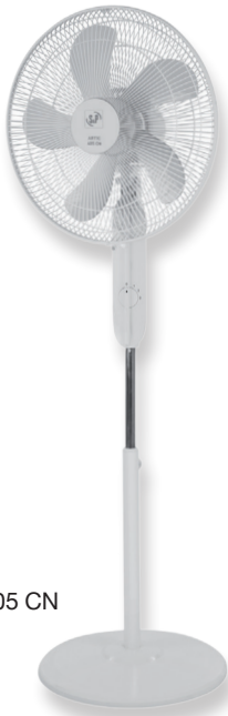
ARTIC 405 CN