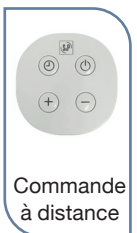
Commande à distance