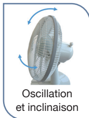
Oscillation et inclinaison