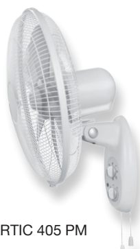
ARTIC 405 PM