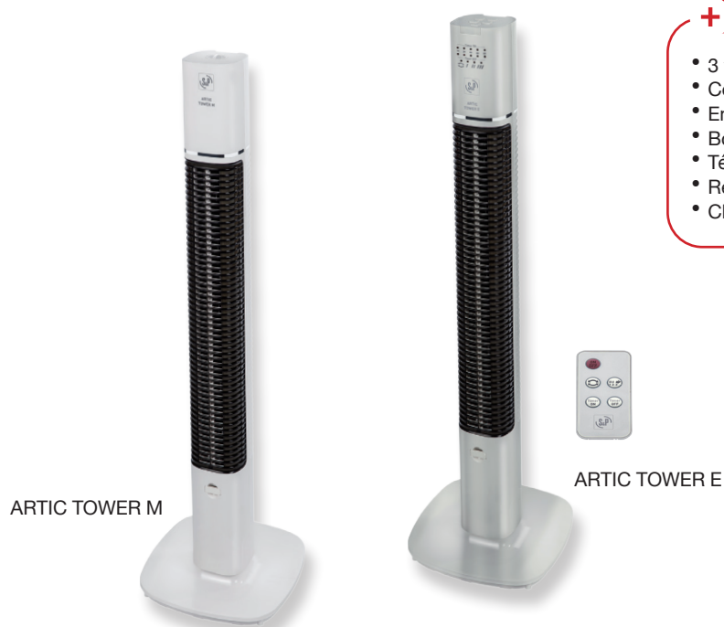
ARTIC TOWER M