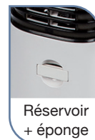
Réservoir + éponge