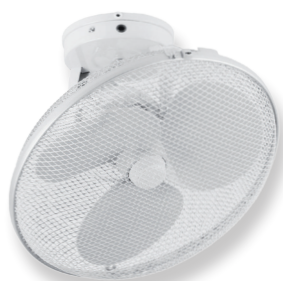
ARTIC 400 R