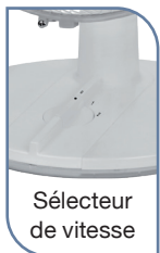
Sélecteur de vitesse