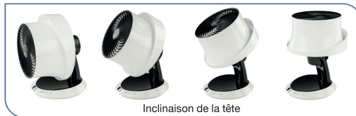
Inclinaison de la tête