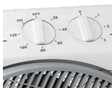
Sélecteur de vitesse