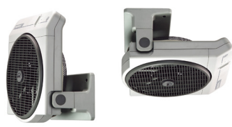
Installation murale ou plafond