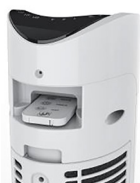
Poignée transport + rangement télécommande