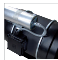
Boîte à borne extérieure