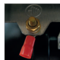
Prise à la terre